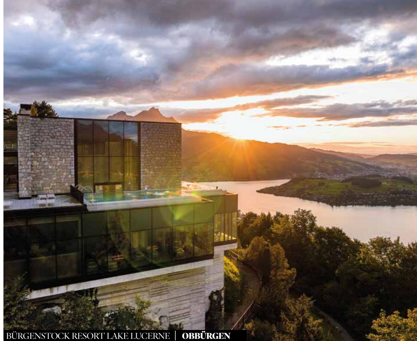
BÜRGENSTOCK RESORT LAKE LUCERNE | OBBÜRGEN