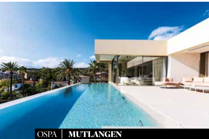
OSPA | MUTLANGEN