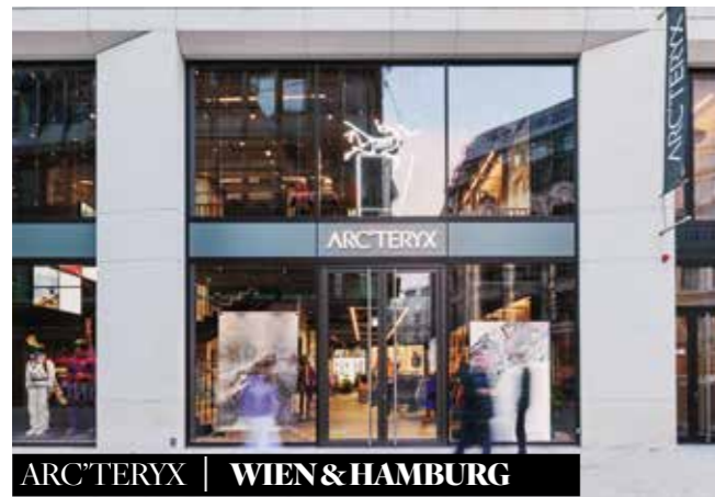
ARC'TERYX | WIEN &amp; HAMBURG