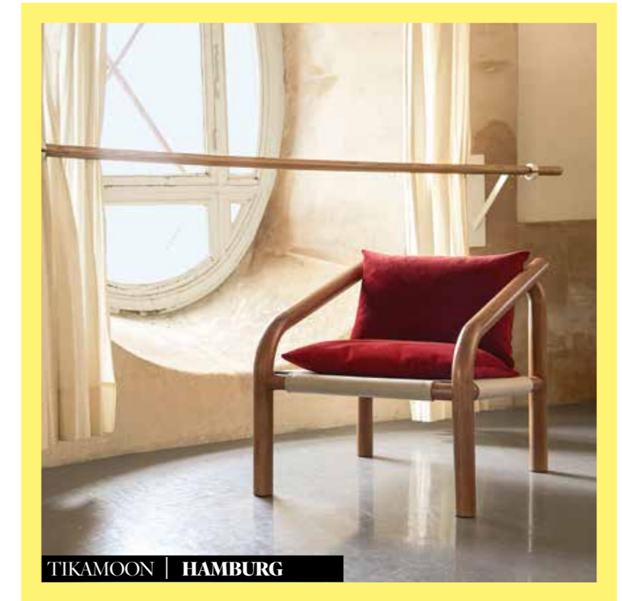
TIKAMOON | HAMBURG