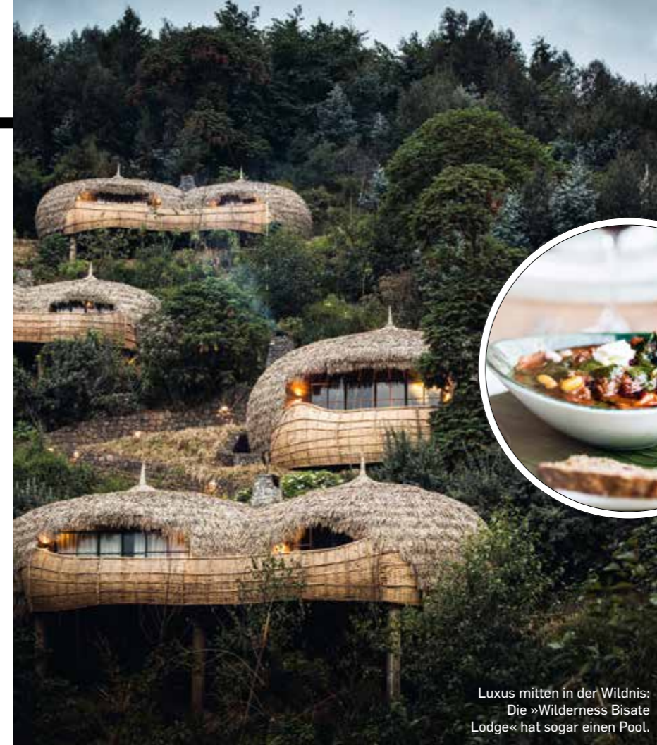
Luxus mitten in der Wildnis: Die »Wilderness Bisate Lodge« hat sogar einen Pool.