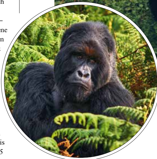
Die Zoologin und Verhaltensforscherin Dian Fossey lebte zeitweise mit den Berggorillas der Virunga-Region zusammen. Ihr Buch »Gorillas im Nebel« wurde mit Sigourney Weaver verfilmt.

Dass wir so viel über Berggorillas wissen, liegt auch an der legendären Dian Fossey. Die US-amerikanische Zoologin und Verhaltensforscherin beobachtete bis zu ihrem gewaltsamen Tod im Jahr 1985